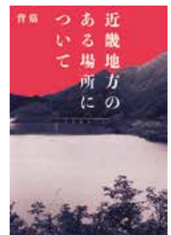
『近畿地方のある場所について』 著: 背筋 KADOKAWA

ご友人を捜す背筋さんは綴ります。お読みいただき、情報をお持ちの方はご連絡ください。是非皆さんも読んでください。そして、見つけてくださってありがとうございます(読めば分かるはず)。