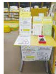
令和5年度の子ども読書まつりのイベントの様子