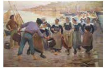
アルフレッド・ギユ 《コンカルノーの鬚加工場で働く娘たち》 1896年頃 油彩・カンヴァス カンペール美術館蔵 collection du musée des beaux-arts de Quimper

時/4月13日(土)~6月2日(日) 9:00~17:00 ※入館は閉館30分前まで ※金曜は20:00まで、初日は10:00~ 会/広島県立美術館 料/一般1,500円、高・大学生1,000円 小・中学生700円 問/広島県立美術館 TEL.082-221-6246 詳しくは Web 広島県立美術館 検索