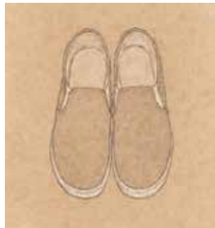
作品タイトル「一歩ずつ」