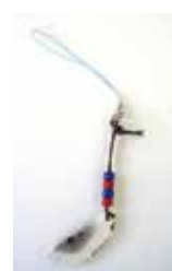
「鹿角ストラップ」 見本