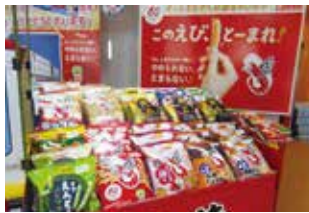
工場見学の申込みはカルビーのHPから。「百聞は一見にしかず」ですね

次に本日の見学者8名が揃ったところで工場見学担当者からガイダンスを受けた。「かつばえびせん」は、①原料のエビは頭から尻尾まで丸ごと殻ごと生地に練りこんでいる。②油で揚げず煎って膨らませてサクサク食感にこだわっている。③1袋製造するのに原料から出荷まで3日間もの工程を要する。など見学担当者からの説明は分かり易く、社会見学で訪れる小学生にも好評らしい。