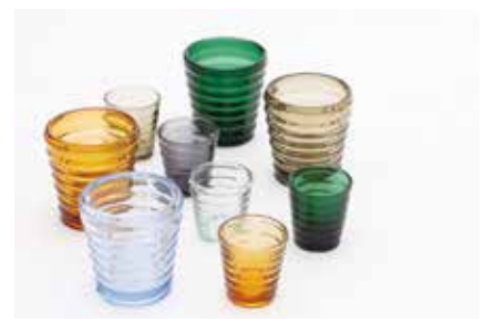
アイノ・アアルト(タンブラー&ショットグラス「ボルゲブリック」)オリジナルデザイン 1932年、カルフラ/イッタラ、スコープ蔵、撮影:八田政玄 画像提供:世界文化社

時/4月6日(土)~6月2日(日) 9:00~17:00 ※入館は16:30まで 会/ひろしま美術館 料/一般1,500円、高・大学生1,000円 小・中学生500円 問/ひろしま美術館 TEL.082-223-2530 詳しくは Web ひろしま美術館 検索