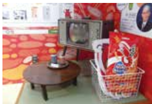
懐かしい昭和の「かつばえびせんのある風景」