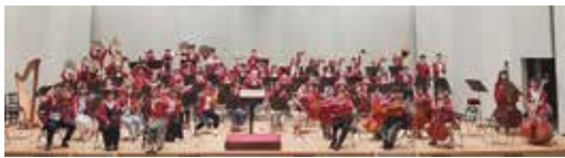
練習は霞キャンパスにて、毎週水曜日 18:30～20:30 と毎週土曜日 13:00～16:00。

主に広島大学霞キャンパスに通う医歯薬学部の学生で構成されるオーケストラ。春と秋の定期演奏会、11月の霞祭のほか、医療機関、介護施設、イベントなど学外の演奏依頼にも積極的に対応しています。1人の行動・演奏が全体の音に影響し、それは聴衆に伝わる。そんなオーケストラの在り方は、将来命を預かる医療従事者の生き方にもプラスになるとの思いから、音楽を通して周りとの歩幅を合わせる演奏を心掛けているそうです。