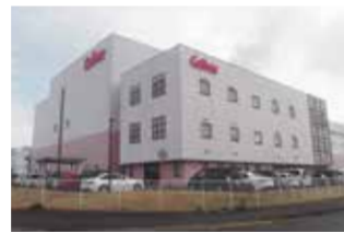
国内で一日約58万袋製造されている「かつばえびせん」。その生地も広島工場で作られている