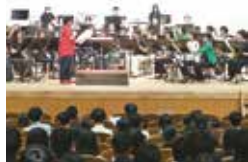
コンサートの様子