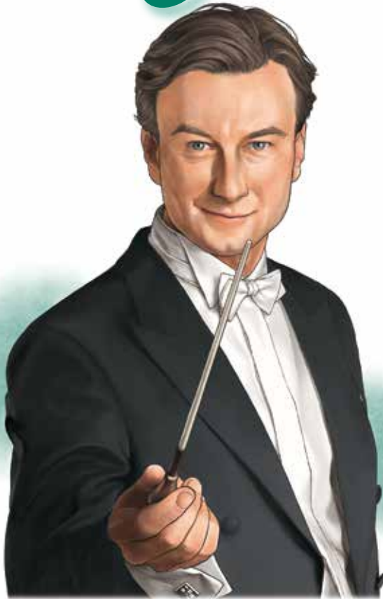
クリスティアン・アルミンクさん 指揮者

ウィーン生まれ。レオポルト・ハーガーや小澤征爾のもとで研鑽を積み、ボストン響や新日本フィルにデビュー。ヤナーチェク・フィルの首席指揮者、ルツェルン歌劇場およびルツェルン響の音楽監督などを経て、2003～13年に新日本フィル、2011～19年にベルギー王立リエージュ・フィルの音楽監督として活躍。2017年から広島交響楽団の首席客演指揮者を務め、2024年4月に同団の音楽監督に就任する。これまでにチェコ・フィル、ドレスデン・シュターツカペレ、フランクフルト放送響、ウィーン響、ザルツブルク・モーツァルト管、トゥールーズ・キャピトル国立管、スイス・ロマン管、ボストン響、シンシナティ響、N響などに招かれ、オペラではフランクフルトやストラスブールの歌劇場、新日本フィルなどで《ドン・ジョヴァンニ》《サロメ》《ホフマン物語》《フィレンツェの悲劇》などを指揮している。2019年には小澤征爾音楽塾オペラ・プロジェクトで小澤征爾と共に《カルメン》全4公演を指揮した。レコーディングも数多く、ヤナーチェク・フィルとのヤナーチェク、シューベルト作品、新日本フィルとのブラームス／交響曲第1番、マーラー／交響曲第3番および第5番、リエージュ・フィルとのフランク／交響曲ニ短調などをリリース。また、シルバ・オクテット、リエージュ・フィルとの共演によるディスクがドイツ・グラモフォンからリリースされた。