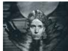
ジョアン・カイガー 《デカルト》