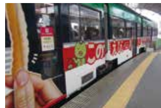
広島電鉄ラッピング車両運行中。「このえび、とーまれ！」が走る

その後、製造工程が見渡せる2Fへ案内されたが、コアな場所だけあって、撮影禁止。それでも工場スタッフが25秒間の手洗い後にクリーンルームに入る様子を見るとその緊張感はガラス越しにも伝わってくる。製造工程では自動化された設備の中で大量の「かつばえびせん」がベルト上を流れていくのにただ圧倒され続けた。この広島工場からは西日本全域に発送されている。