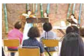
さろんコンサートの様子