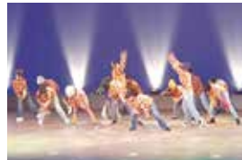
昨年度開催の様子