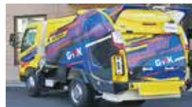
回転板式塵芥車「G-RX」 歳

(展示室への入場は16:30まで) 休 毎週月曜日(4/29、5/6を除く) 3/21(木)、4/30(火) 会 ノマジ交通ミュージアム1階エントランスホール 2階特別展示室ほか 料 大人510円、高校生相当・シニア(65以上)250円(観覧料) ※こどもの日(5/5)は高校生入館無料 問 ノマジ交通ミュージアム TEL.082-878-6211