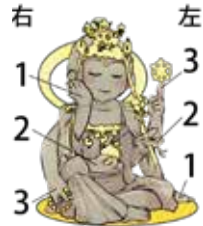
如意輪観世音菩薩半跏像

如意輪観世音菩薩は、如意宝珠(宝の珠)と、法輪(元々は武器であり仏の教えのことで迷える人々を救うといわれ、奈良時代から信仰されてきました。多くは6本の腕を持っていて、右手1は手を頬にそっとあて、2は手のひらに宝珠をのせ、3は数珠を持ちます。左手1は下に伸ばし台座につき、2は蓮華を差し出し、3は上を示し法輪を支えています。数珠や法輪などの持物は失われていますが、円明寺の菩薩も例外ではありません。顔は救いを求める人々をなんとか助けたいという、慈愛に満ちた優しい表情です。なんとなく疲れた時、癒されたい時、会いに行ってみてはどうでしょう。