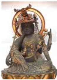
木造如意輪観世音菩薩半跏像

このお堂内に安置されているのが本尊の「木造如意輪観世音菩薩半跏像」です。室町時代末から桃山時代の作と考えられますが、とても保存状態が良く、切金で描かれた衣の模様も、瓔珞(ネックレス)も鮮やかに残っています。とても400年以上経ている仏像には見えません。長い年月、本尊が大切に守られてきた証です。