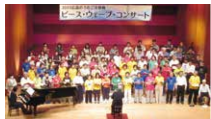
「ピース・ウェブ・コンサート」の様子(2023年)

◆活動日/毎週水・金曜日 18:45~20:50(週1回も可) ◆《団費》4,000円/月 《入団費》1,000円 ◆問/広島合唱団 TEL.082-294-3981