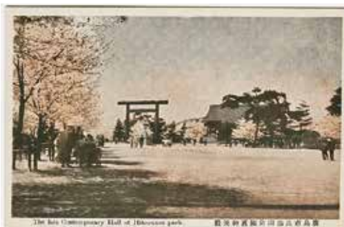
御便殿の絵葉書(昭和(戦前)頃発行)(広島市公文書館蔵)

御便殿は原爆の爆風で倒壊、消失。石灯笼だけが少し場所を移して残っています。今も広場を囲むように桜が植栽され、春は花見で賑わいます。