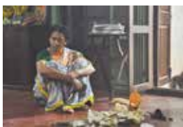
「シヴァランジャンとふたりの女」

アジア映画のフィルムアーカイブとして、アジア各国の多くの映画フィルムを収集保存している福岡市総合図書館。今回はそのコレクションの中から、2019年のアジアフォーカス・福岡国際映画祭で観客賞を受賞した『シヴァランジャンとふたりの女』(インド)などアジア映画の秀作8作品を上映します。