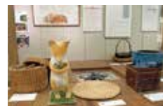
展示風景「村の生活(すまう)」

童話『ごんぎつね』は新美南吉の代表作で、教科書に採用されるなど、幅広い世代に愛されている物語です。この企画展では、『ごんぎつね』のストーリーを交えながら、物語に登場する昔の道具や情景、人々の暮らしの様子を紹介します。