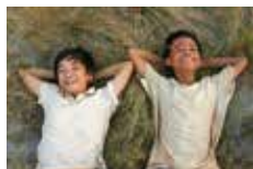
「虹の兵士たち」