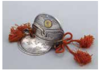
《舞楽兜形ボンボニエール》1934年 宮内庁三の丸尚蔵館蔵