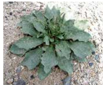
▲ハマサジ イソマツ科の越年草