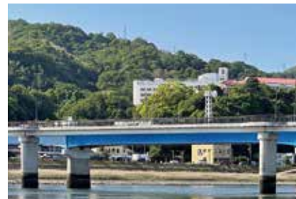
▲己斐橋付近の水辺に希少植物の群生を見ることができる