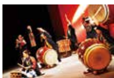
太鼓本舗かぶら屋

1部はワークショップ参加者の発表と地元で活動している和太鼓グループによる若さ溢れる演奏を、2部のゲスト出演は、広島文化を発信している「太鼓本舗かぶら屋」の演奏をお楽しみください。