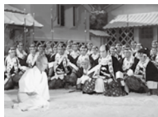
「赤穂浪士」

会 マエダハウジング安佐南区民文化センター ホール 料 全席自由 1作品300円(当日400円) 問 マエダハウジング安佐南区民文化センター TEL.082-879-3060