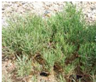
▲フクド キク科の多年草