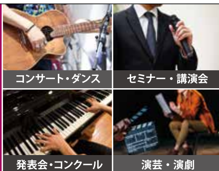
コンサート・ダンス