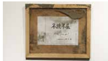
Chim↑Pom Never Give Up 2011 Photo: Kei Miyajima Courtesy of the artist, ANOMALY and MUJIN-TO Production

時 / 1月25日(火)～30日(日) 11:00～20:00 ※最終日は16:00まで 会 / gallery G 料 / 入場無料 問 / gallery G TEL.082-211-3260 詳しくは Web