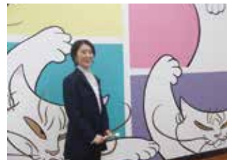
生まれも育ちも東京ですが、曾祖母は倉橋島。 「小さい頃、よくみかんを送ってくれました」