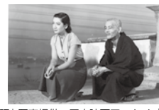
『東京物語』

日本の映画史に名を残す名匠、小津安二郎監督の、親子の関係を見つめた戦後の代表作を紹介。『東京物語』を含む4作品を上映。