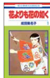
『花よりも花の如く 1』 著：成田美名子 ¥472 (税込) 出版社：白泉社 ©成田美名子/白泉社

作者の成田美名子さんは「能楽好き、というよりは世阿弥好き」なのだそう。タイトル「花」は、能楽の大成者世阿弥が芸の魅力や面白さを花とたとえた言葉から。若さの花は「時分の花」。特別な魅力ですが、時を過ぎれば失われます。若さを過ぎてから「真の花」を咲かせることができるかどうか、それが勝負だと世阿弥は言います。本作の主人公、榊原憲人は若き能楽師。子方時代から能の世界に生きる若者です。ひたむきに能の道を歩む姿が丁寧に描かれているのですが、成田さんの作風でしょうか、明るく爽やか。なんだか憲人君がかわいい後輩のように思えてきて、舞台へのチャレンジも、若さゆえの切ない恋も、応援したくなります。他人事ではないのですが、憲人くんには「真の花」を咲かせてほしいなああと心から願ってしまいます。世阿弥の言葉はすべての人への人生論と読むこともできるのです。世阿弥の著書「風姿花伝」も併せてお勧めいたします。