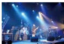
令和元年のバンドフェスの様子

高校生から60代まで、幅広い年齢層の出演者によるバンドフェス。ロックでもさまざまな楽曲が楽しめます！