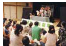
親子で楽しめる人形劇です。

時 1月23日(日)①10:15～②11:30～ 会 安佐北区民文化センター 大広間 料 入場無料 ※ワークショップのみ材料費100円 問 JMS アステールプラザ内 安佐北区民文化センター事業担当 TEL.082-244-8000