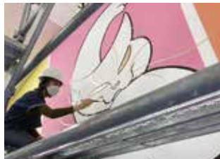
壁画は初めて。 大キャンバスに挑む。