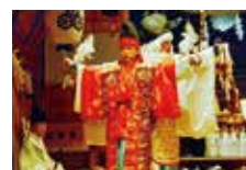
吉松幸四郎監督作品 『木魅(こたま)』より神楽シーン

広島で活動、または広島と縁のある映像作家たちの自主制作映画の作品から2作品を上映します。