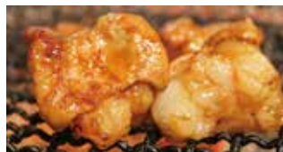
店主もお肉が大好き。勉強を兼ね休日には焼肉の食べ歩きに出かける。

【ごろう横川店】 西区三篠町1丁目7-18 TEL / 082-537-0007 営業時間 / 時短営業期間のみランチあり 11:00～14:00 通常17:00～23:00 (アルコール22:30 L.O.) 定休日 / 火曜(祝日の場合は水曜)