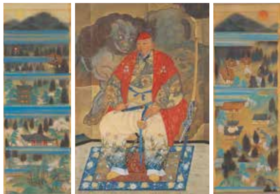
福田恵一《豊公》 大阪城天守閣蔵