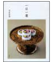
木村宗慎 『一日一菓』 (新潮社刊) 単行本発売中 ¥5,000+税

「一日一菓」、自由に出掛けられない今だからこそ、自宅で抹茶を一服。穏やかに過ごしたいとき、傍らに置きたい名著です。