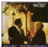
『エイプリル・イン・パリ』 カウント・ベイシー・ オーケストラ CD発売中 ¥1,980 (税込) 発売元：©ユニバーサル ミュージック

藤井政美さんおすすめの一冊『エイプリル・イン・パリ』カウント・ベイシー・オーケストラ