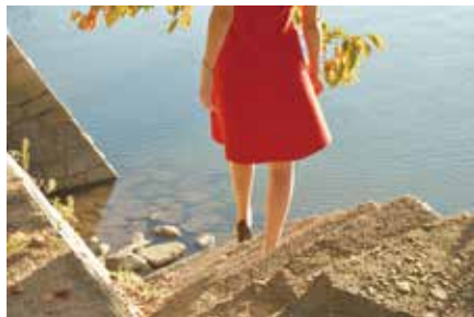
藤岡亜弥「川はゆく」より