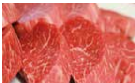
牛の命を二度殺さぬよう丁寧に扱うことを信条としている。

横川駅のガードをくぐった先、大きな牛の看板が目印。肉の鮮度と量に定評があり、週末は予約必須の人気店。丁寧に洗ったシマチョウ(750円)、隠し包丁を入れたミノ(750円)、切りたてのハラミ(1,880円)など、肉本来の旨味をほんの少しでも損なわないよう繊細な手仕事をほどこしたメニューの数々。旨さの理由を聞けば、気さくに教えてくれる店主の人柄。各テーブルにダクトを設置し炭火でも空気がキレイなど、居心地のいい理由をあげるときりがなし。焼肉をオーダーすると土鍋ご飯(0.5合)の無料サービスあり。1階カウンター8席、2階テーブル30席。