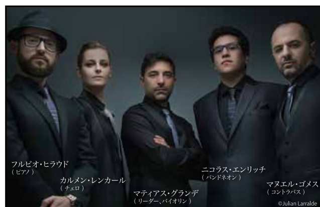
フルビオ・ヒラウド (ピアノ)