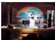
前回公演(2017年度)「班女」

時 2月15日(土)・16日(日)14:00～ 会 JMSアステールプラザ 中ホール能舞台 料 全席指定 S席4,500円、A席3,000円 問 ひろしまオペラ・音楽推進委員会 TEL.082-244-8000