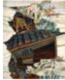
桂ゆき(積んだり) 1951年、福岡市 美術館蔵