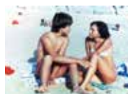
「海辺のポーリーヌ」