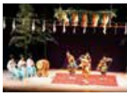
前回の神楽公演の様子

演目：天の岩戸開きの舞、荒平の舞、滝夜叉姫など 時 1月19日(日)12:30～ 会 安佐南区民文化センター ホール 料 無料 問 安佐南区民文化センター TEL.082-879-3060