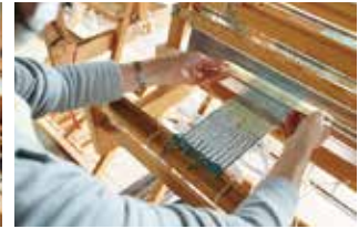
調子が出てきました

自らが撚った糸を、緯糸として織り込んでいく。両手、両足を使って操る機織でも、スタッフの助言を受けながらすぐに習熟し、織りあがった部分が伸びていく。予定の時間を余して、皆さんの「マイコースター」が織りあがる。10cm四方の一枚の布は、「山まゆ」ならではの優しい薄緑色がほんのり浮かんで、その天然由来の温もりは4人の達成感をより、大きくしたようだった。