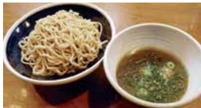
つけダレの中は炭火で炙った香ばしいチャーシュー、メンマ、小口切りのネギ。

基本メニューは『つけそば』(並750円～)と『油そば』(並700円～)の2つ。麺に深いこだわりがあり、小麦栽培から手掛けられた希少な北海道産小麦粉を使用した自家製麺。『つけそば』のつけダレはイリコ、ホタテからとったダシに鯖の干物から作る自家製削り粉を入れるなど、魚介系の風味が前面に立った他にはない味。辛味は一切なく、麺の風味を一層引き立てるため軽く酸味もプラスされている。店内には食材の生産者が名前や写真入りで紹介されており、随所に産地へのリスペクトが感じられる。麺を食べ終わったら、つけダレに鶏ガラスープ(無料)を投入し、おむすびと一緒に最後の一滴まで味わい尽くすのがお薦めの食べ方だ。オープンキッチンでカウンター10席のみ。