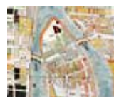
「広島町新開絵図」の一部 広島市文化スポーツ 部文化振興課蔵

会 郷土資料館 料 大人100円、高校生・シニア50円(入館料)、中学生以下無料 問 郷土資料館 TEL.082-253-6771