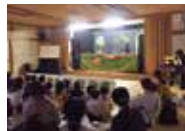
親子で楽しめる人形劇です。