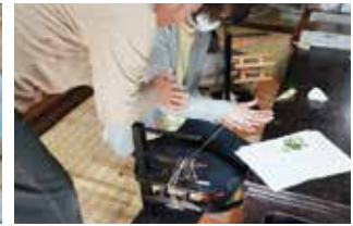
両手で優しく糸を撚っていく