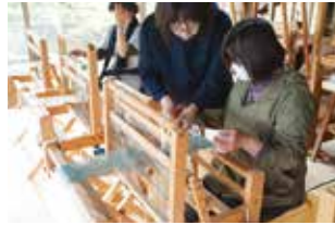
手ほどきを受けながら織っていく